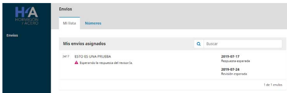
Fig. 1. Mi lista.

En el apartado " Envíos / Mi lista " se encontrará la lista de tareas a revisar (Fig. 1).