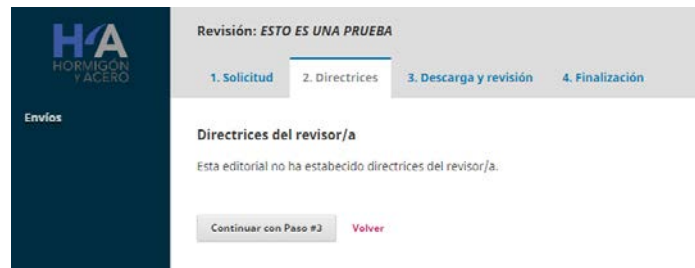
Fig. 3. Directrices.

Si no se han establecido directrices (Fig. 3), "Continuar con Paso #3" que abrirá la pestaña "3. Descarga y revisión".